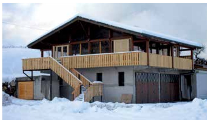
Salle hors sacs de Chaîne d'Or en cours de rénovation