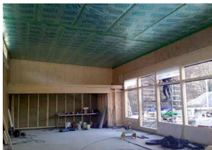
Salle de motricité