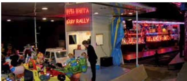
Vogue - août 2016