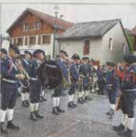
La fanfare du 27 e BSA et ses anciens combattants.