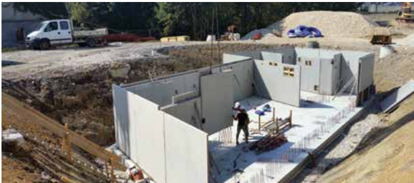
Sous-sol de l'extension - septembre 2016