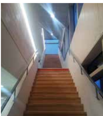
Escalier - coursive