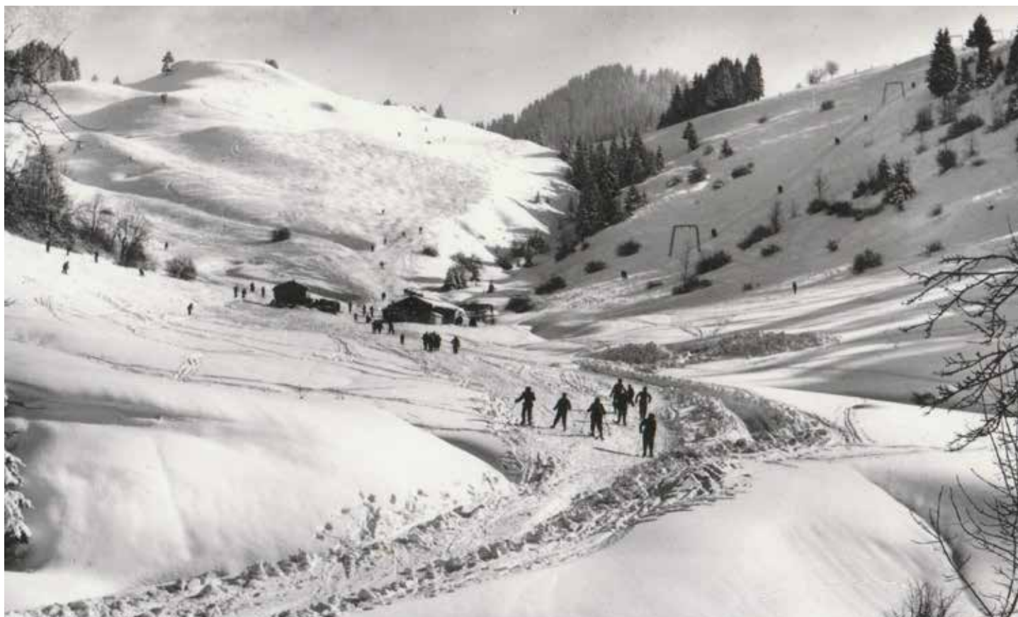
Hameau des Places en 1950 (on distingue le premier télésiège des Rotys)