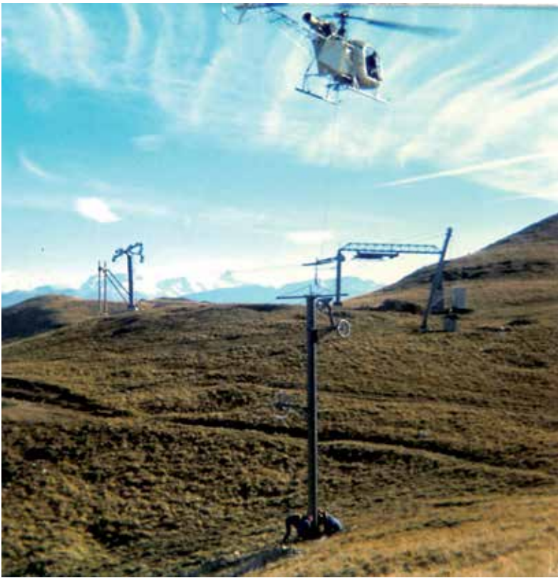
1973 : Montage des Remontées mécaniques