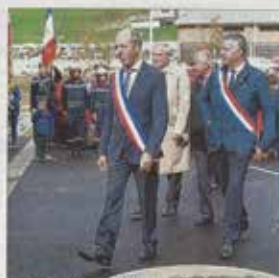
Cérémonie des officiels autour du préfet Pierre Lambert.