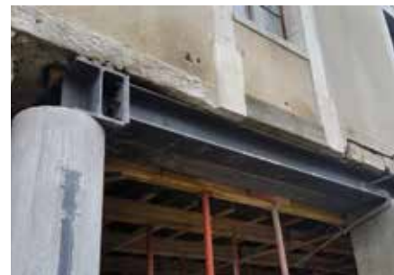
Transformation de l'ancien bâtiment