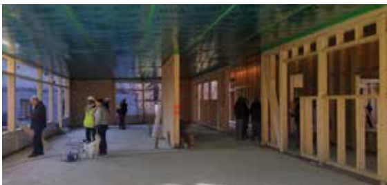
Réunion de chantier - décembre 2016