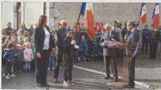
La remise du drapeau aux enfants des écoles. C'est-à-dire dans la salle principale du nouveau groupe scolaire.