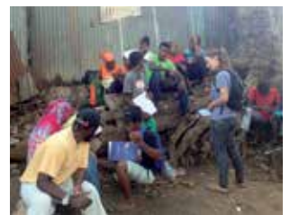
Cours dans le bidonville

Cette expérience m'a fait découvrir une nouvelle culture très éloignée de la nôtre et m'a fait ouvrir les yeux sur la précarité de certains. De plus, cette mission m'a aidé à choisir mon futur métier, celui d'éducatrice spécialisée, que j'espère exercer plus tard sur cette île magnifique qu'est Mayotte.