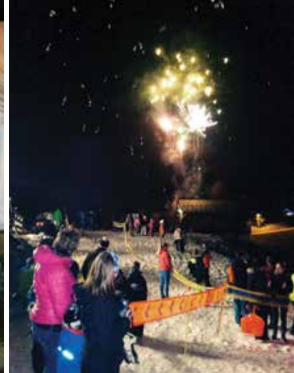
Chaîne d'Or s'anime et s'illumine le 23 février 2017 pour les 45 ans de la station