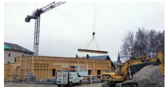
Montage de l'extension - novembre 2016