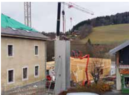
Montage de la cage d'ascenseur