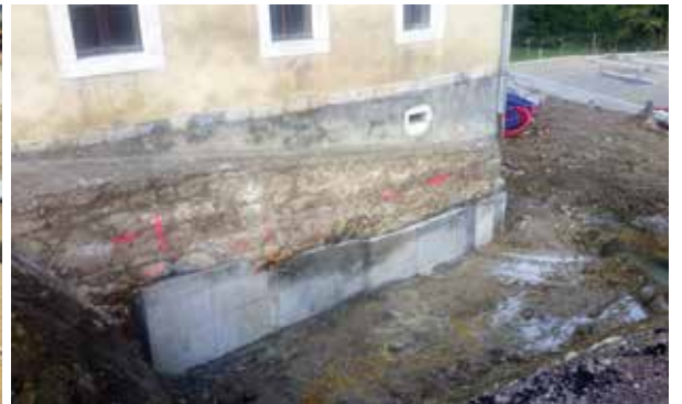
Reprise en sous-œuvre - octobre 2016