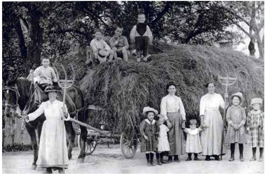
« Femmes et enfants travaillant aux champs pendant la guerre 14-18 »

Les normes imposées par les commissions de contrôle du lait destiné à la fabrication du reblochon ont contribué à maintenir des méthodes d'exploitation respectueuses de l'environnement comme l'utilisation du fumier, du lisier ou des apports organiques. Ce lait d'une qualité supérieure est donc valorisé en termes de prix mais extrêmement contrôlé dans sa production.