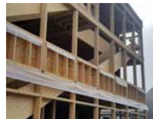
Montage de la coursive janvier 2017