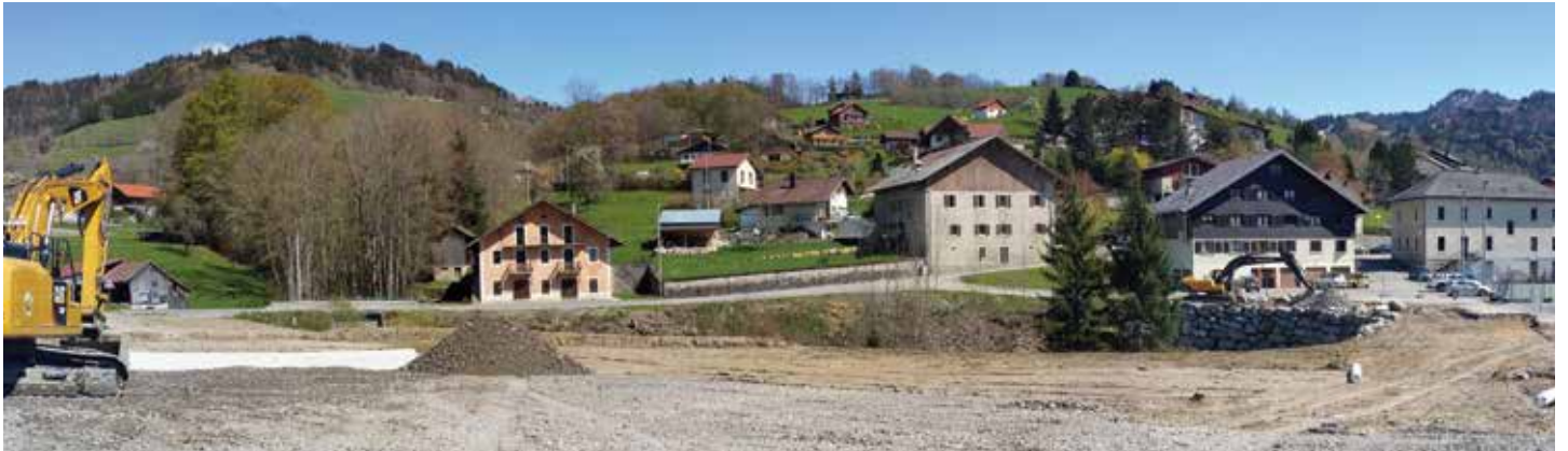
Terrassement du parking - avril 2016