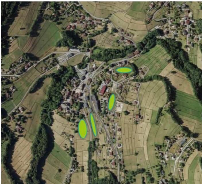
Bourg de BOGEVE

Avec l'urbanisation des secteurs 3 et 4 situés en dents creuses dans le tissu urbain du village, les aménagements des secteurs 1 et 2 vont permettre de fixer les emprises du village et d'accueillir des logements proches de l'ensemble des services et commerces de proximité.