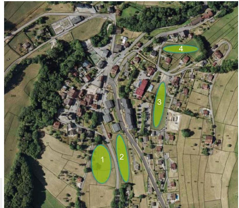
Principaux secteurs d'extension de l'urbanisation

Des liaisons sécurisées entre les secteurs d'extension d'urbanisation, les commerces de proximité, les services et les équipements d'intérêt général et collectif, le groupe scolaire notamment, permettront de limiter les déplacements dans le bourg et de valoriser la qualité de vie dans la commune.